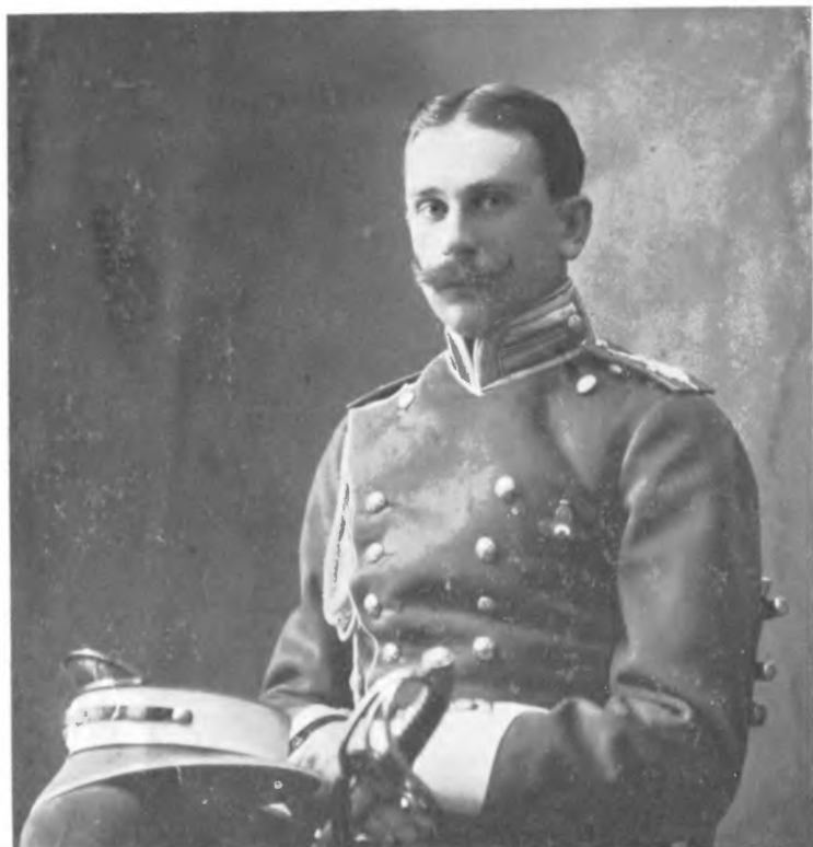
Князь П. П. Ишеев В 1908 году.