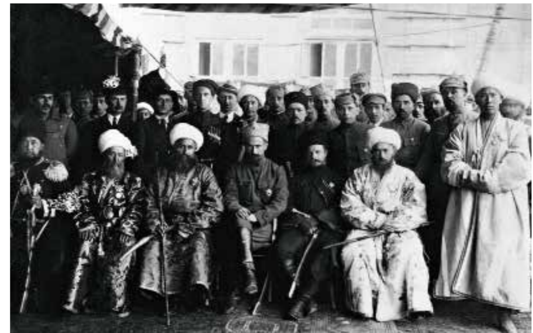
649 Торжественная встреча частей РККА в одном из населенных пунктов Бухарского эмирата Туркестан. 1919