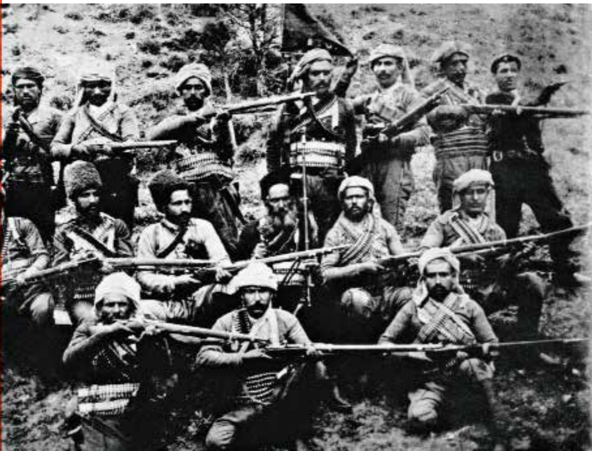
645 Вооруженный отряд самообороны «Хулеб» Туркестан. 1918 Фотограф не установлен ГМП ИР