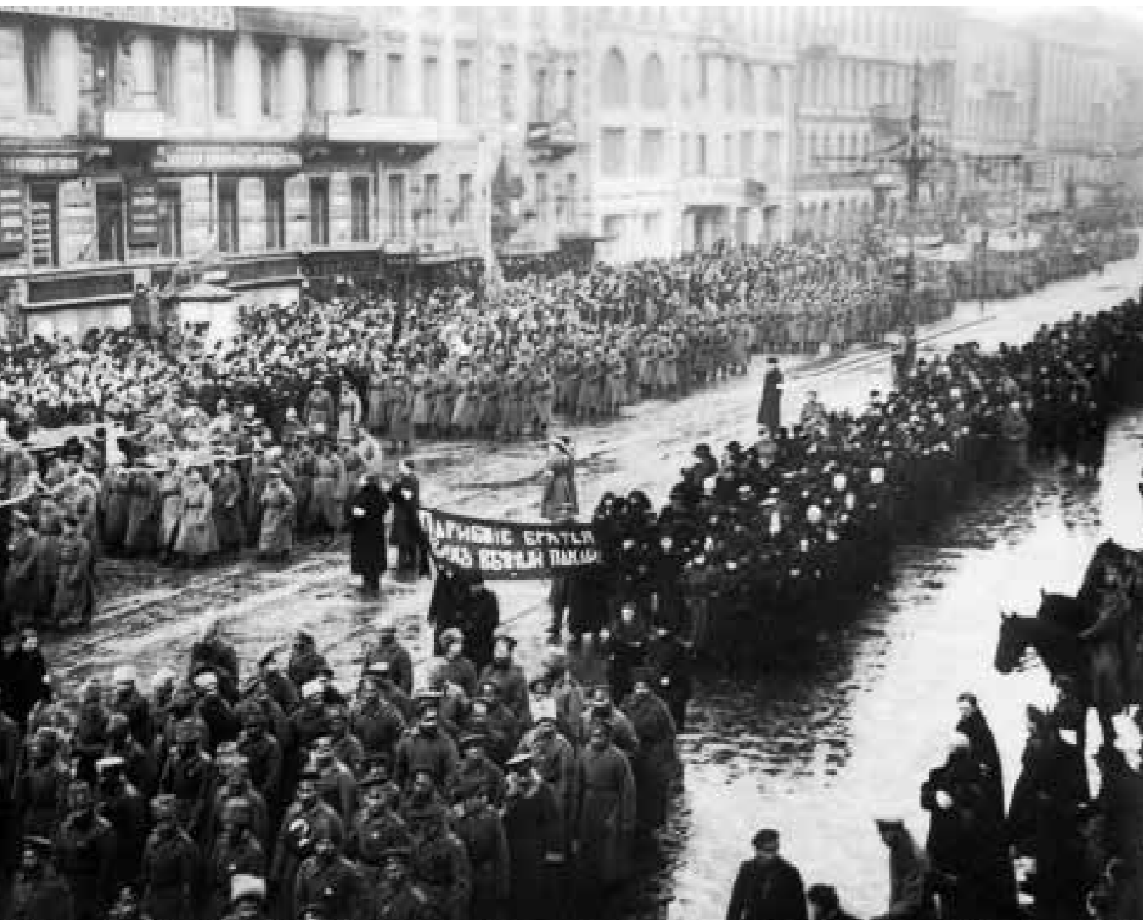
9 Траурная процессия на Невском проспекте во время похорон жертв Февральского переворота Петроград. 23 марта 1917