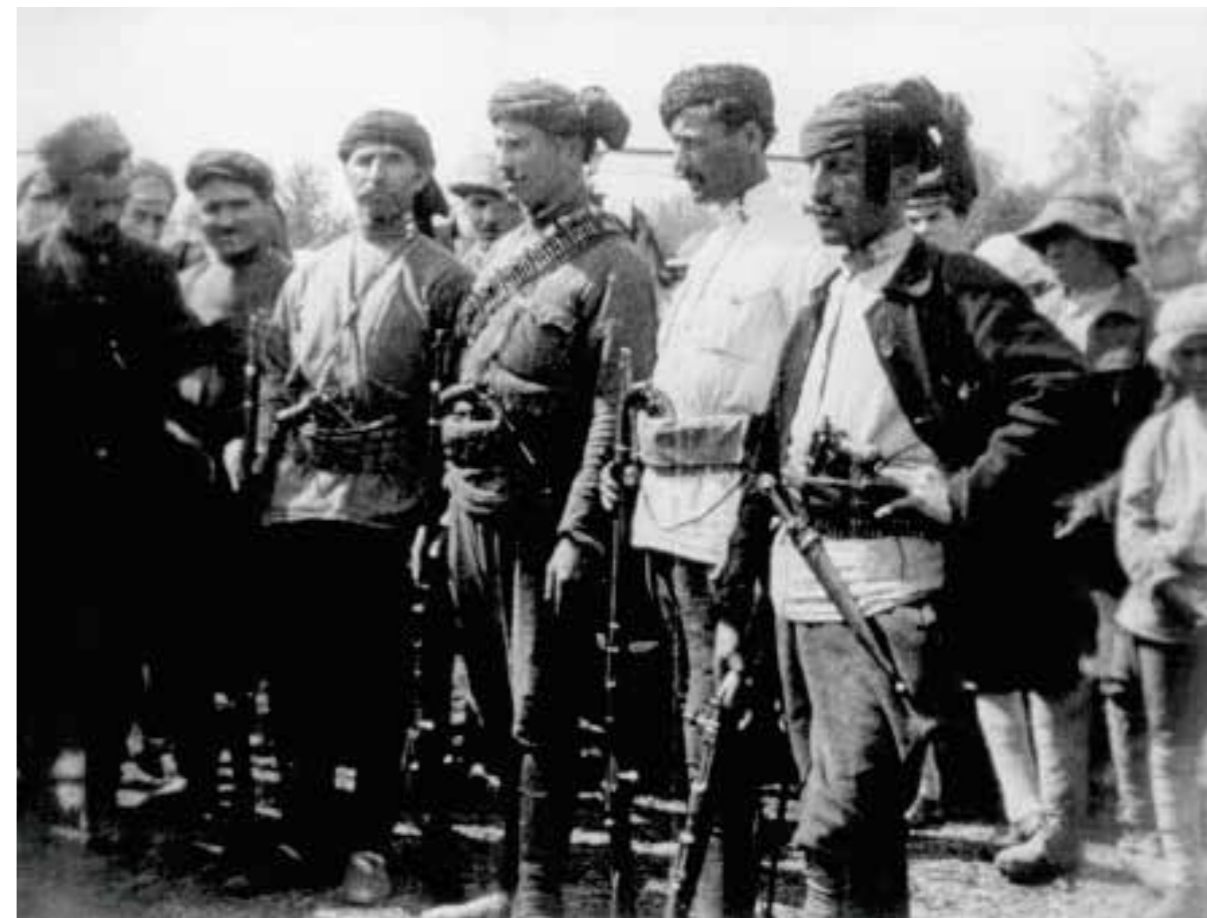
642 Демонстрация в честь установления советской власти в Грузии Весна 1921