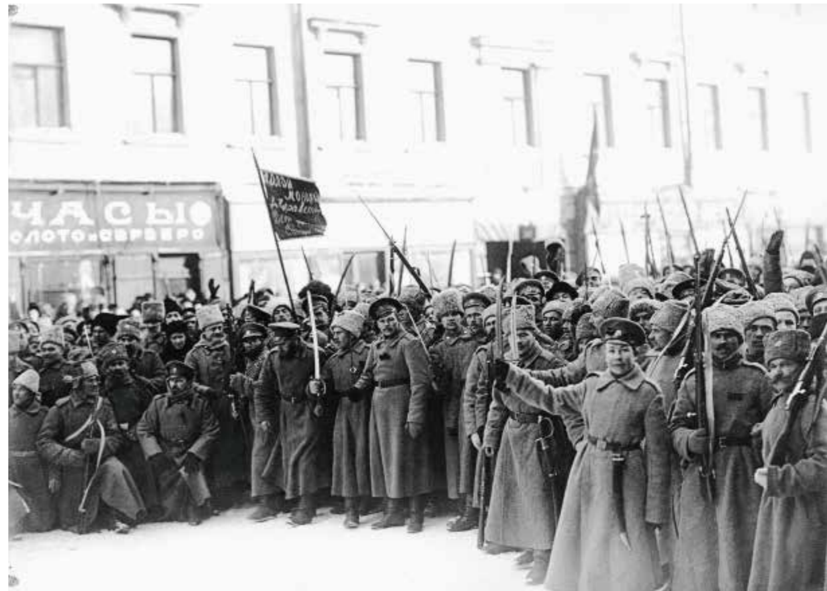
2 Переодетые городовые, арестованные в ходе революционных событий у Технологического института Петроград. Март 1917