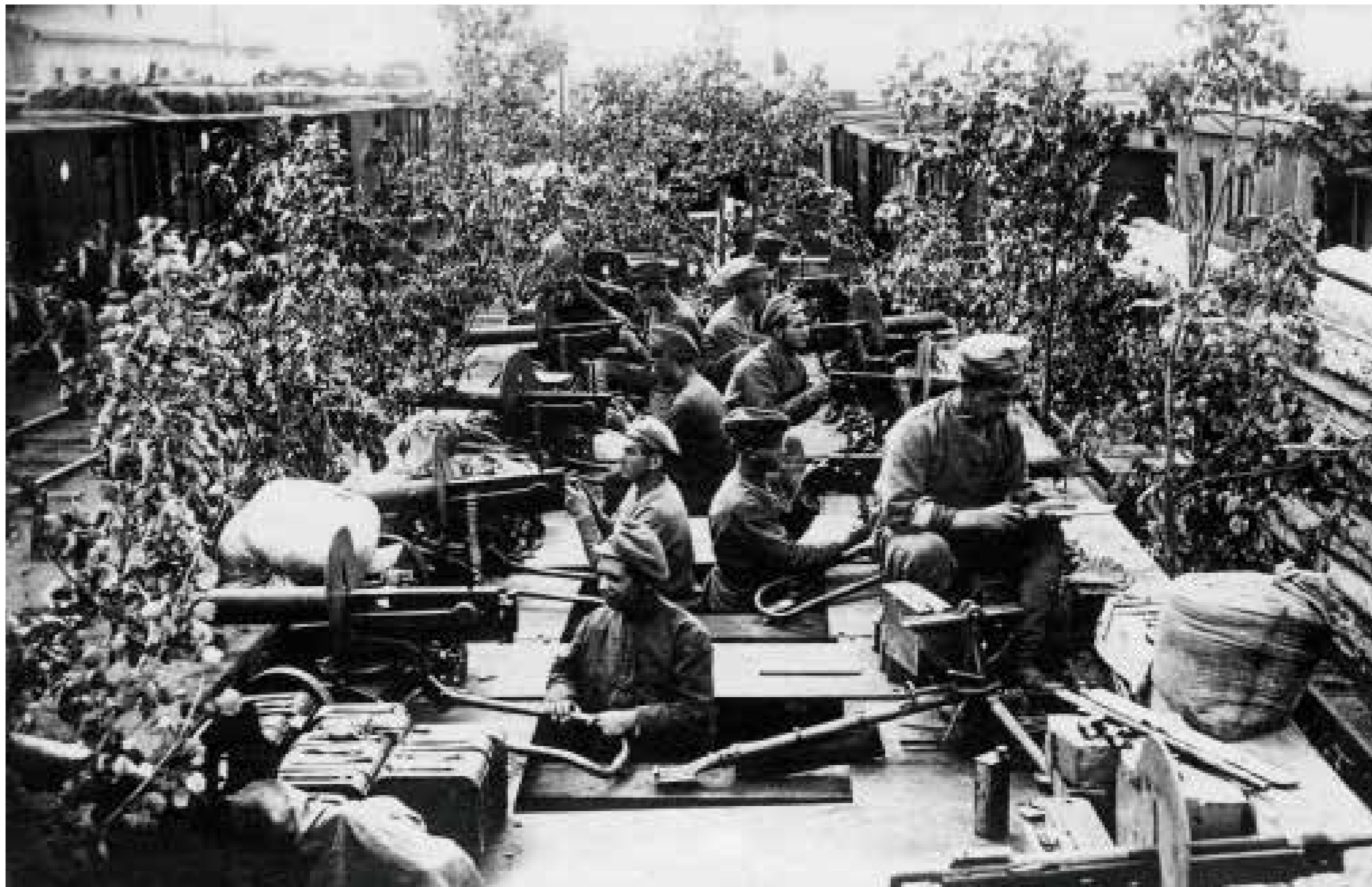
279 Бронепоезд чехословацких войск в Сибири «Орлик» Уфа. Лето 1918