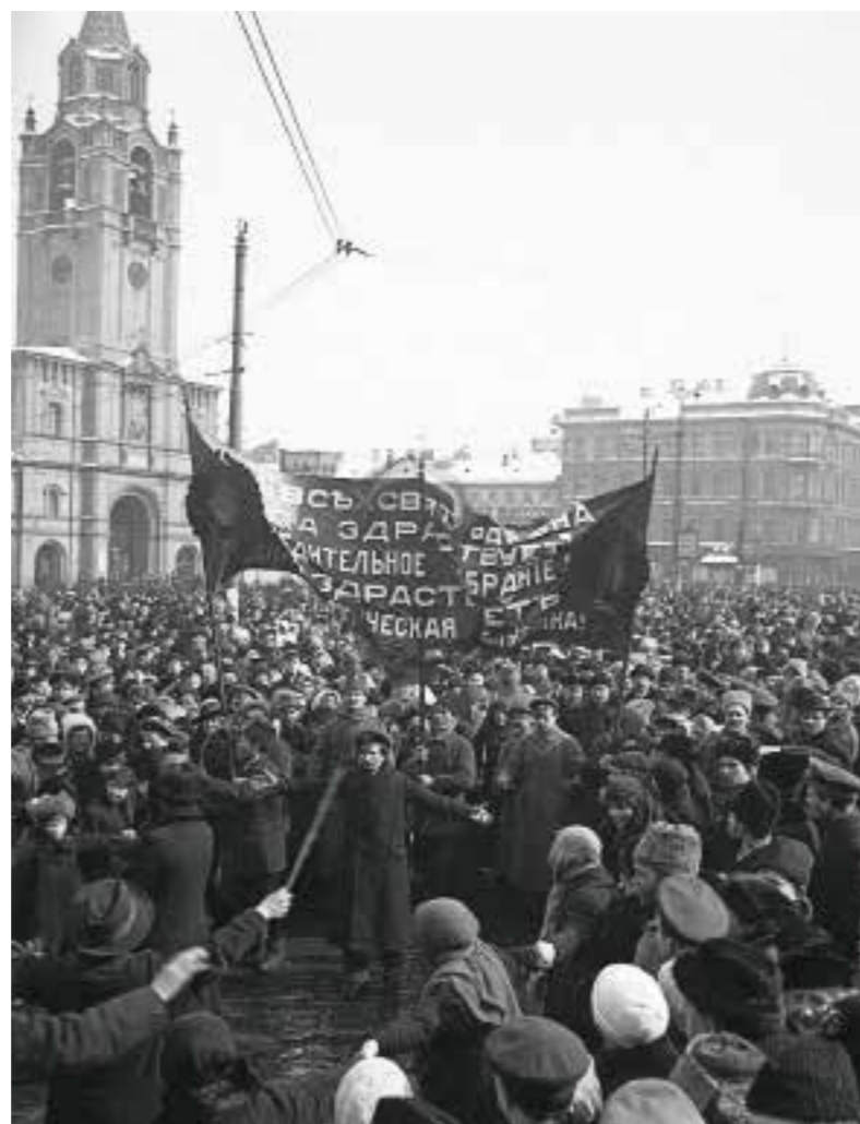
12 Манифестация на Страстной площади в первые дни после Февральского переворота Москва. Март 1917