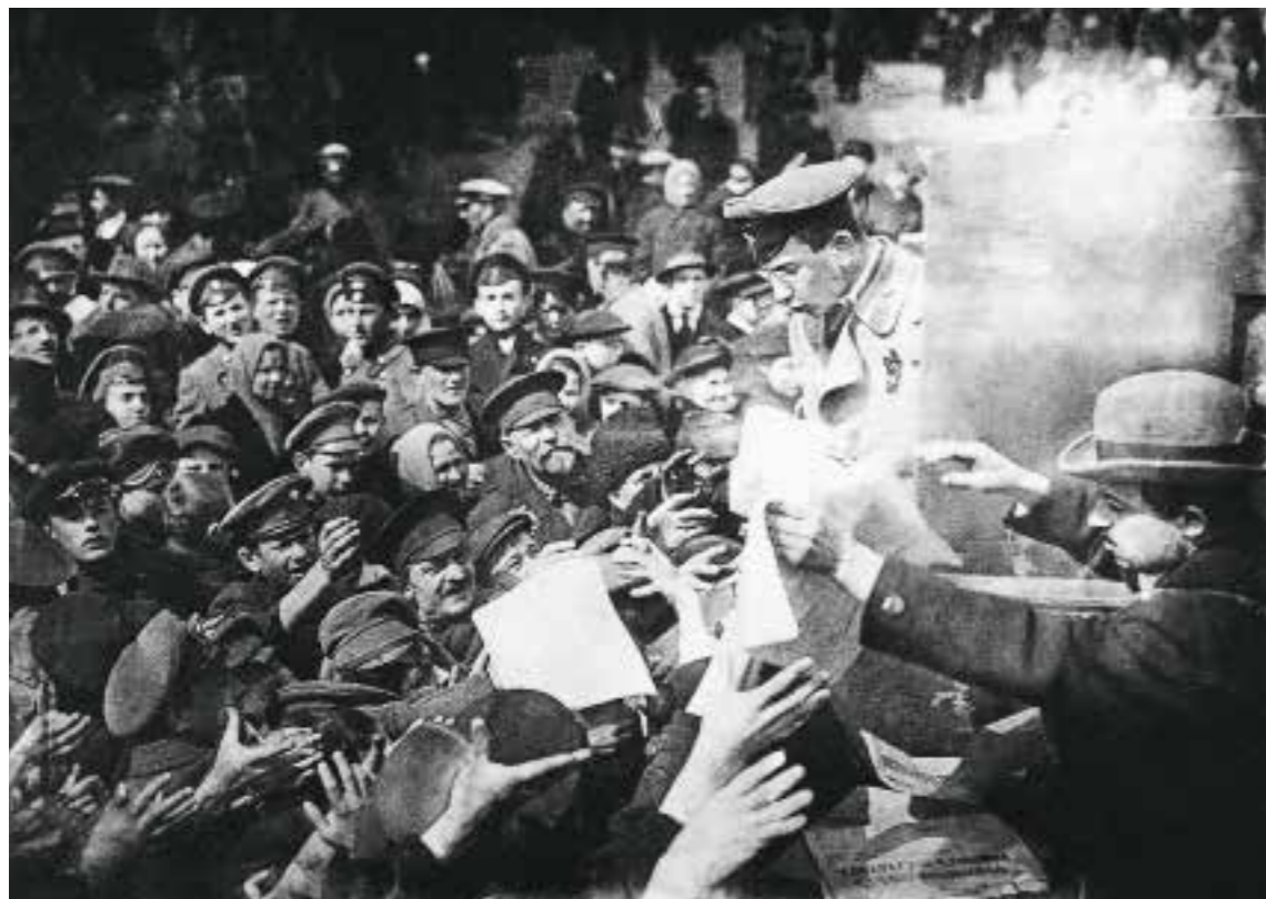
11 Распространение листовок на Тверской улице Москва. Февраль — март 1917