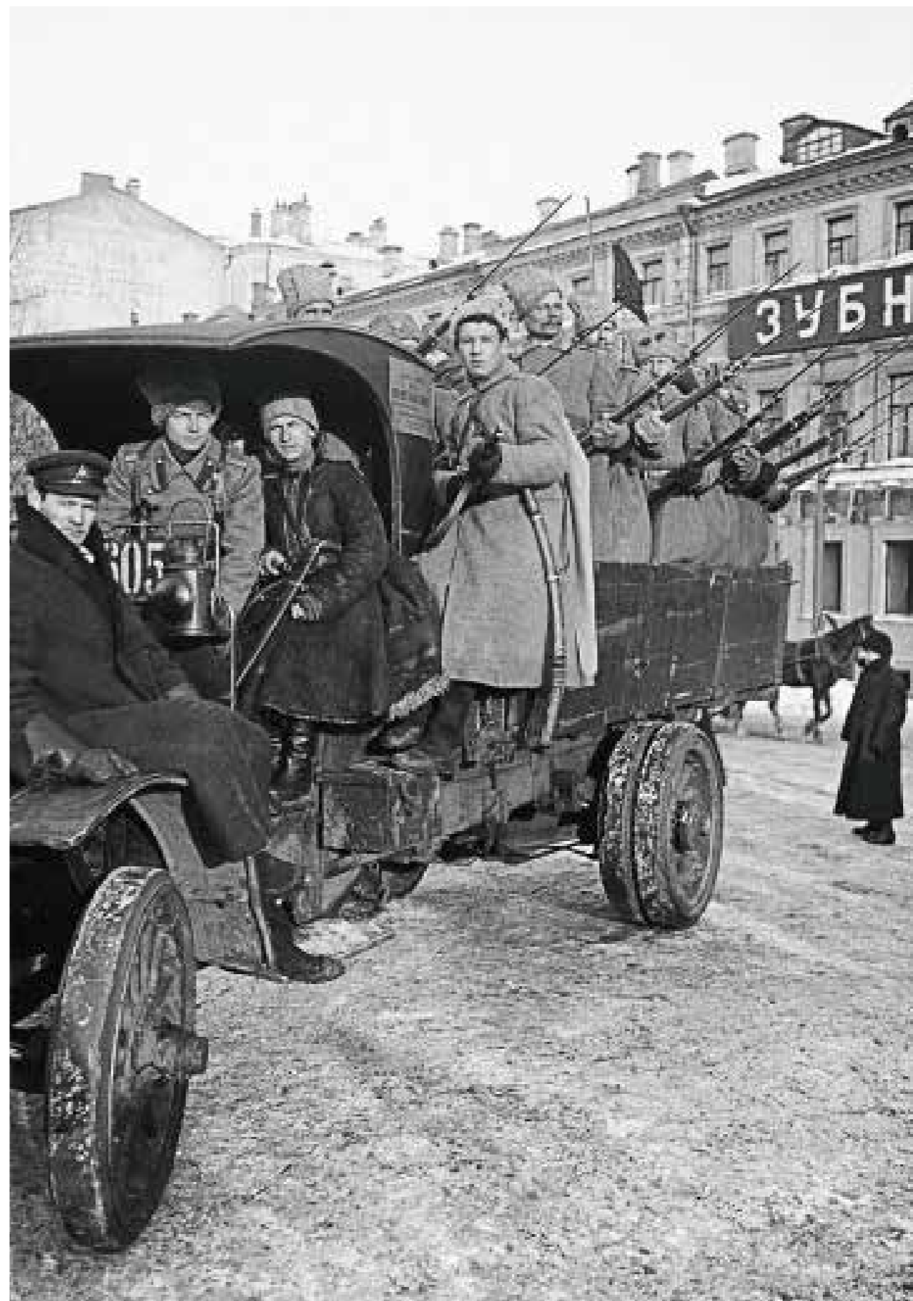
13 Грузовик с революционными солдатами в дни Февральского переворота Москва. Февраль — март 1917