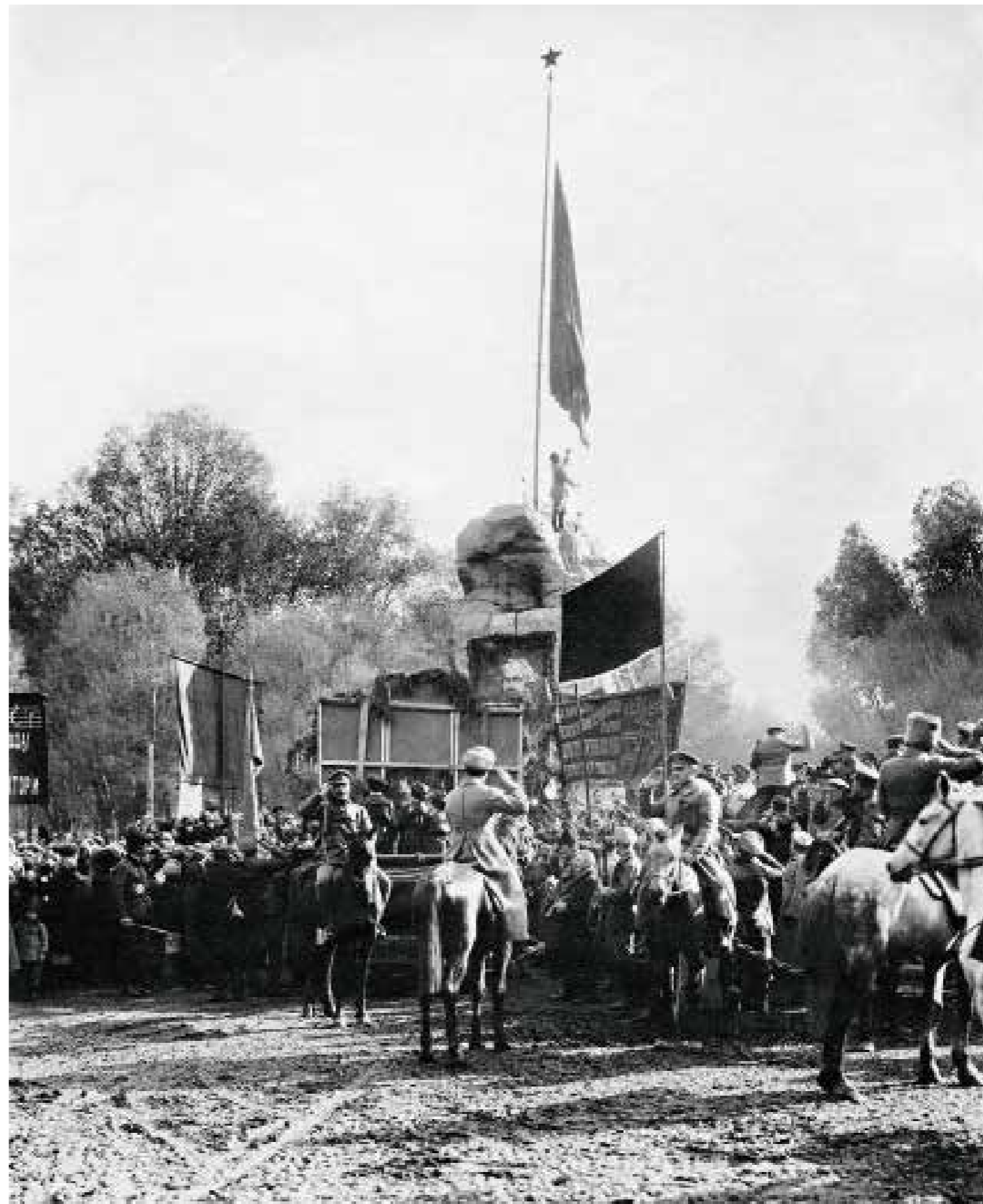
647 Поднятие красного флага Туркестанской автономной советской социалистической республики Ташкент. Май 1918 Фотограф не установлен ГЦМС ИР