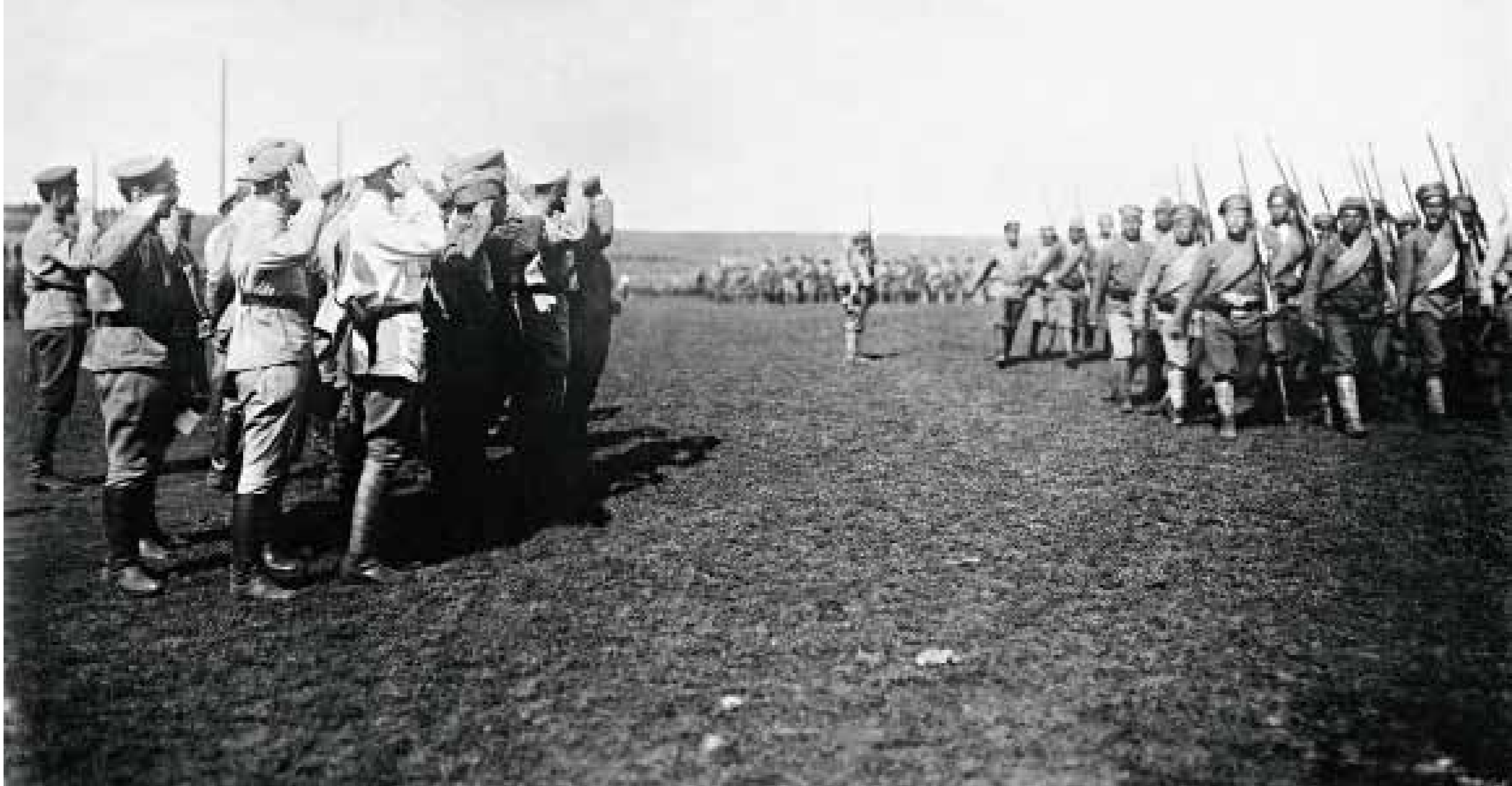
648 Командующий Туркестанским фронтом М. В. Фрунзе производит смотр частям Татарской бригады