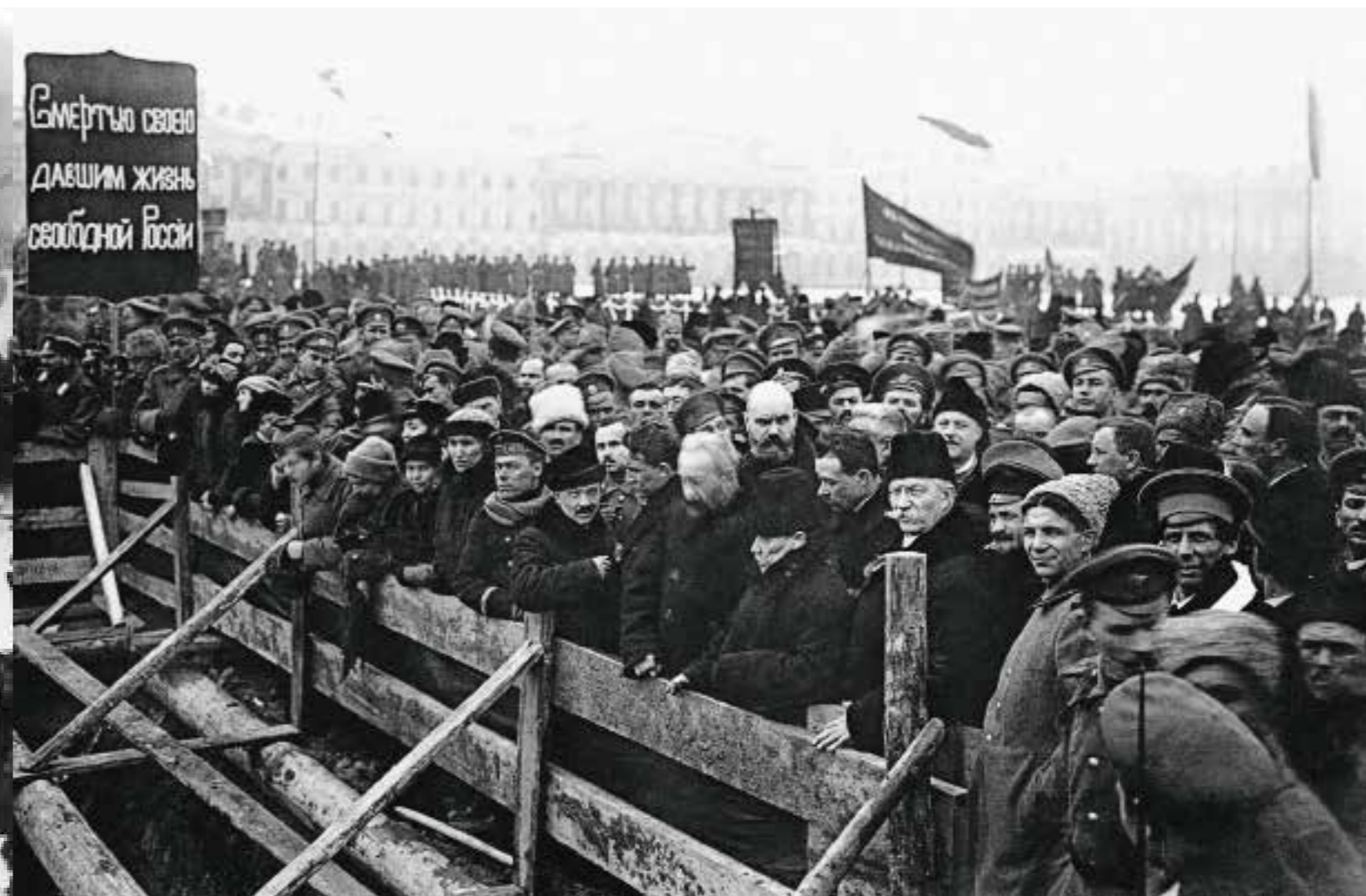
10 Похороны жертв Февральского переворота на Марсовом поле Среди присутствующих: (стоят у ограды в центре) члены Временного правительства — министр-председатель Г. Е. Львов, обер-прокурор Святейшего Синода В. Н. Львов, министр иностранных дел П. Н. Милюков Петроград. 23 марта 1917