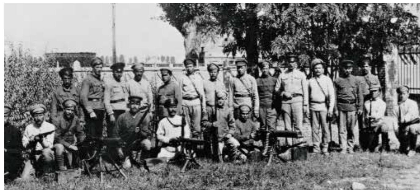
646 Отряд Красной гвардии Туркестан. 1918